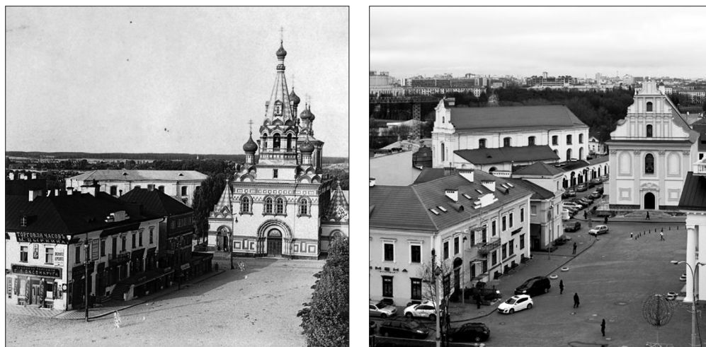
Рис. 2. Вид на площадь Свободы (до революции – Соборная) в 1912 г. (слева) и 2012 г. (справа)

губернским центром Российской империи" 33 . Не был восстановлен разрушенный в 30-е гг. прошлого века православный Петропавловский собор (на его месте построили здание, напоминающее униатскую церковь Святого Духа, рис. 2), зато по "вольному проекту" возведена ратуша – символ городского самоуправления, который появился в Минске в то самое время, когда активно шёл процесс окатоличивания и полонизации городского населения.