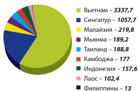
Рис. 2. Прямые иностранные инвестиции Республики Корея в странах ЮВА в 2017 г., млн долл.