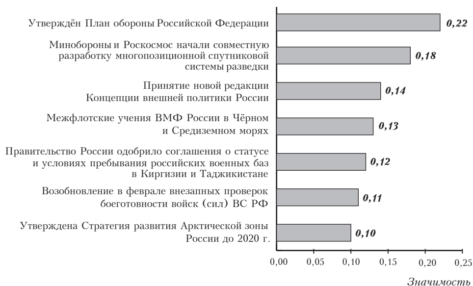
Рис. 1. Экспертная оценка значимости событий, которые оказали (окажут) позитивное влияние на национальную безопасность России в январе-феврале 2013 г.

Рассмотрим события января-февраля 2013 г., которые, по мнению экспертов, оказывают (или окажут в будущем) позитивное влияние на национальную безопасность России (рис. 1).