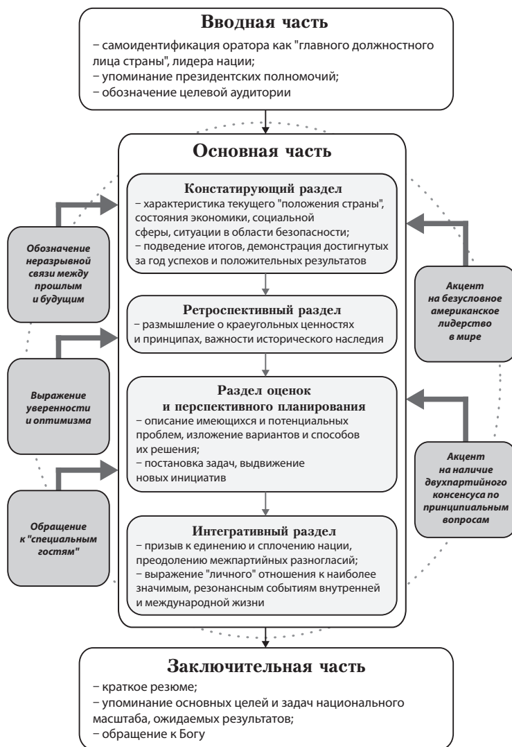
Рис. 2. Разработанная автором типовая схема современного стилистического построения обращения президента США "О положении страны" (порядок изложения материала, обязательные темы, характерные приёмы и формы речевого воздействия на аудиторию)

Таким образом, можно выделить типовую схему стилистического построения ежегодных посланий президента конгрессу и нации, наиболее часто используемые темы и приёмы воздействия на аудиторию (рис. 2).